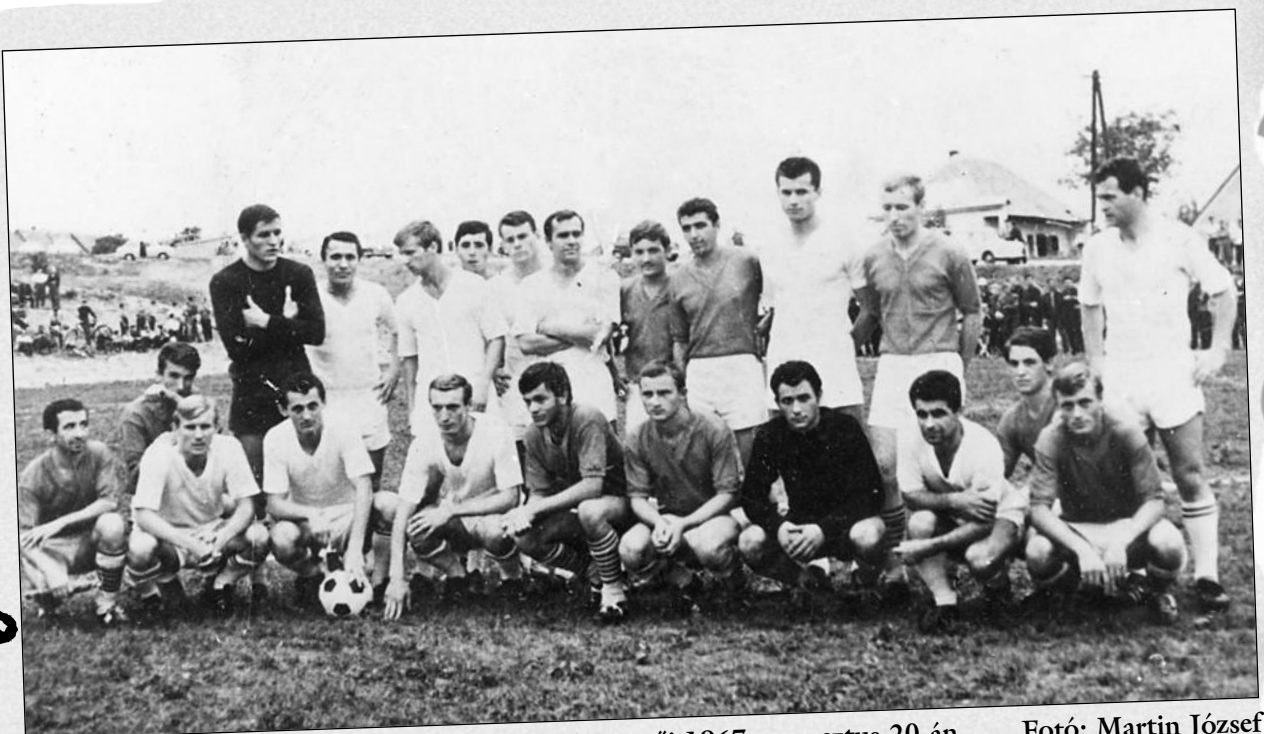
Az Etyek – Ferencváros labdarúgó mérkőzés résztvevői 1967. augusztus 20-án.