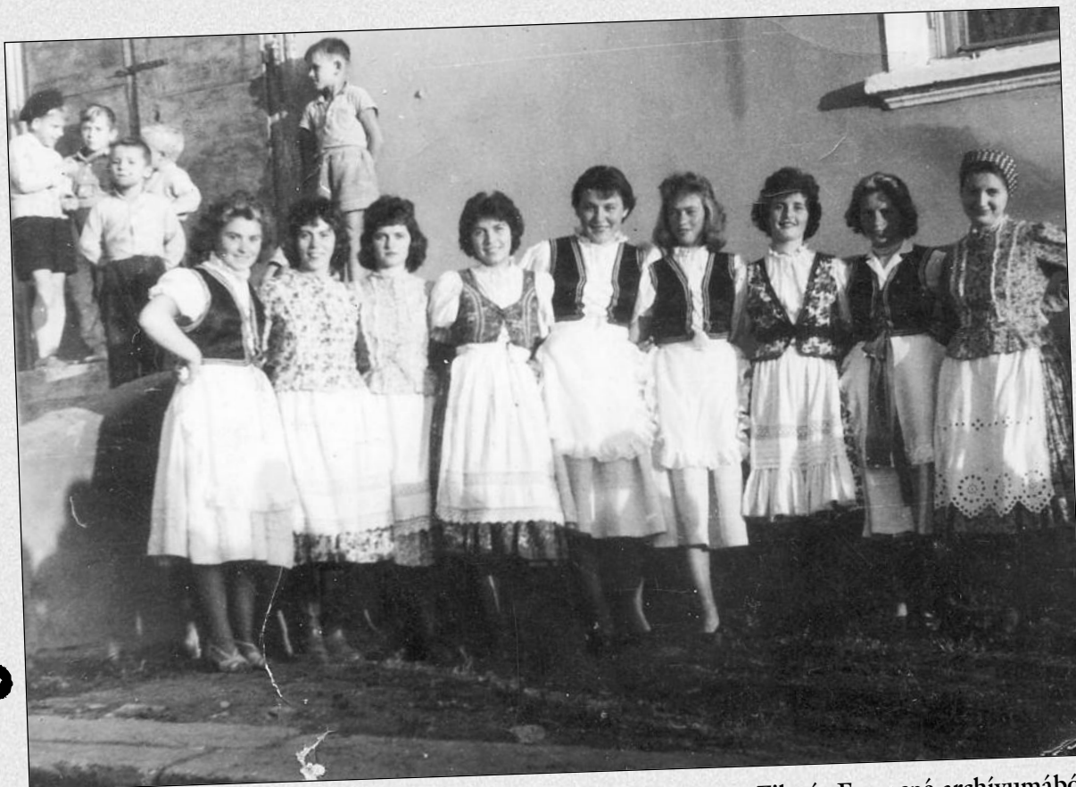
Csőszlányok a szüreti bálban a 50-es években