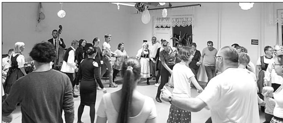
Magyarpalatkai táncház a Hosszúlépés Kulturális Egyesület szervezésében a szüreti mulatság estjén