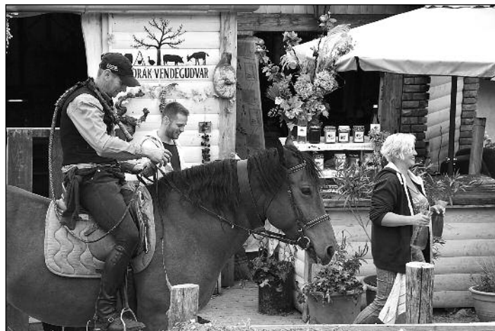
Borral kínálják az Etyeki Borangolón a szüreti felvonulás résztvevőit a Dvorák Vendégudvarnál