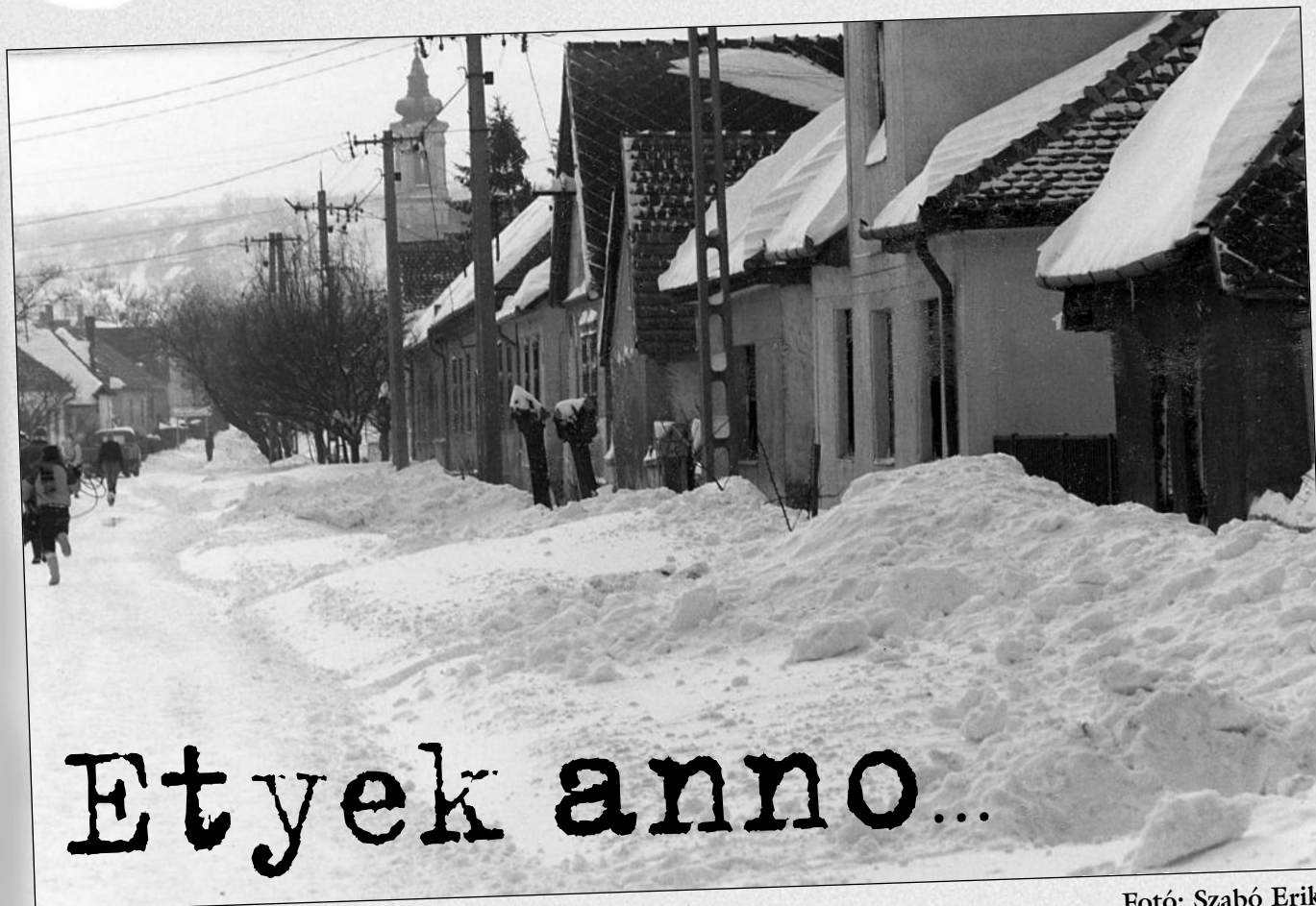
A Kossuth Lajos utca az 1987. januári nagy hóvihár után