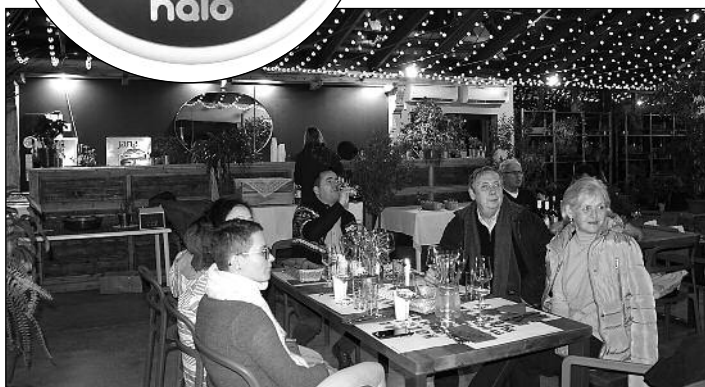
Borgála – Etyeki Borút Egyesület újbor kóstolója a Hernyák Birtokon

A lakossági összefogás révén megvásárolt chip-leolvasó az állateledelel boltban került elhelyezésre. Segítségével talán hamarabb hazakerülnek az elveszett háziállatok. A boltvezető nyitvatartási időben szívesen leolvassa a chip-et – otthagyni azonban nem lehet a talált állatokat.