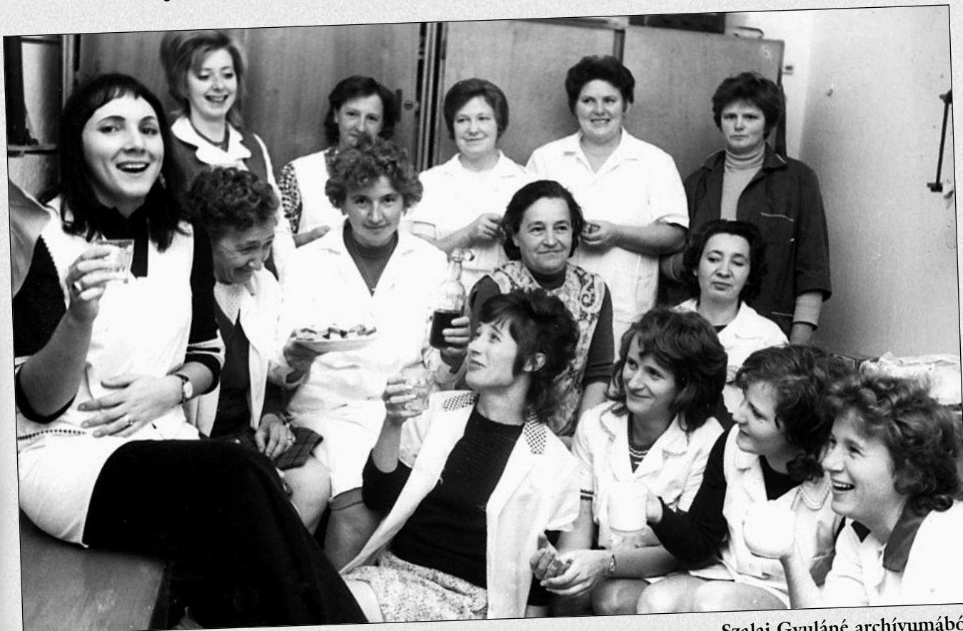
Az óvoda dolgozói a 80-as években