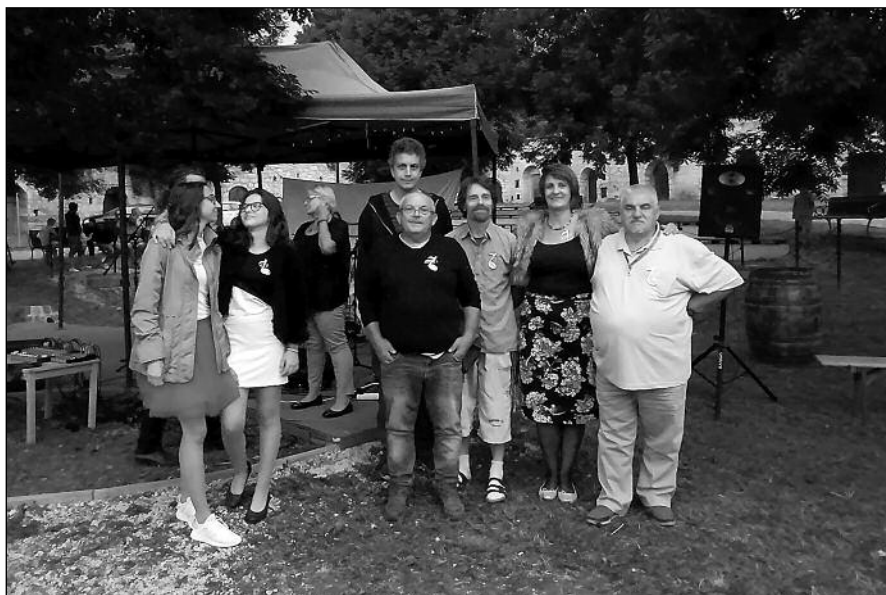
A nyolcadik Szobazenész Fesztivál résztvevői

Etyeki-Botpuszta Fejlesztéséért Egyesület