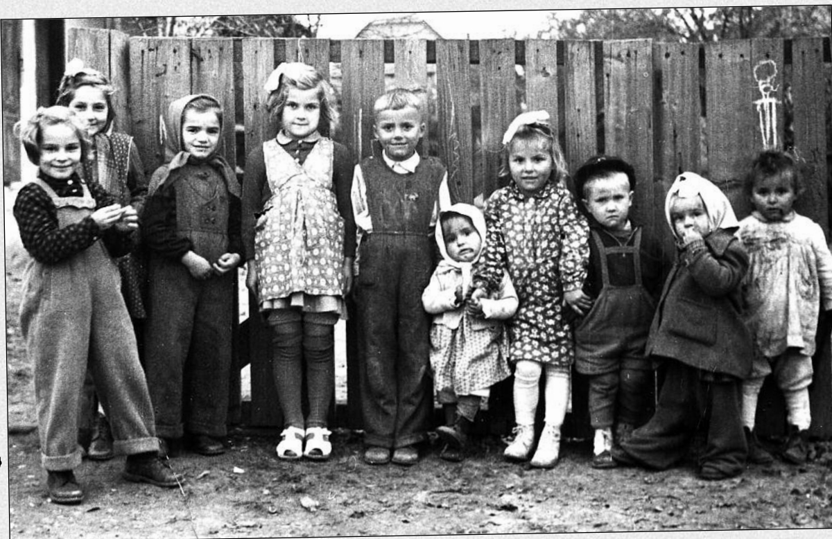
Újtelepi utcák gyerekei az ötvenes években – Fehér Klára archívumából – Fotó: Hajnal Fotó (Budapest)