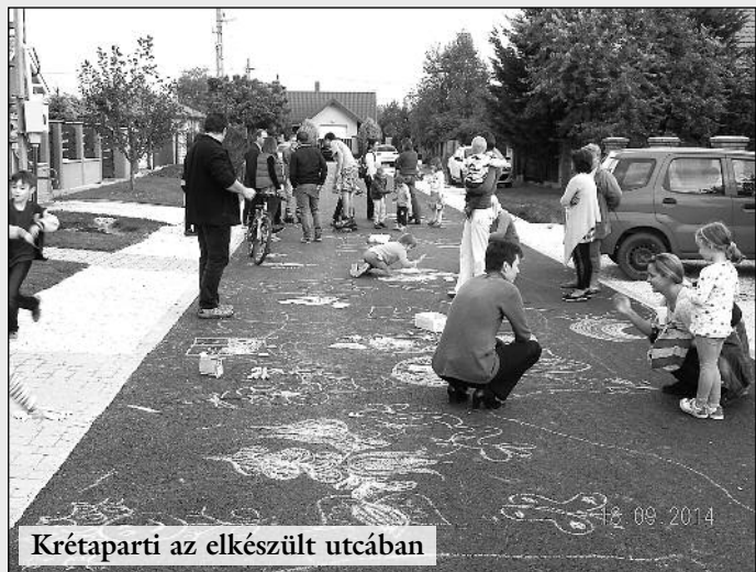
Kréta-parti az elkészült utcában

Településünk szépülése nem csak esztétikai kérdés. A közös gondolkodás, a közös célok megvalósítása a közösség építését is jelenti, és egy-egy új útszakaszon rendezett kréta-parti igazán hangulatos emlékként maradhat fenn.