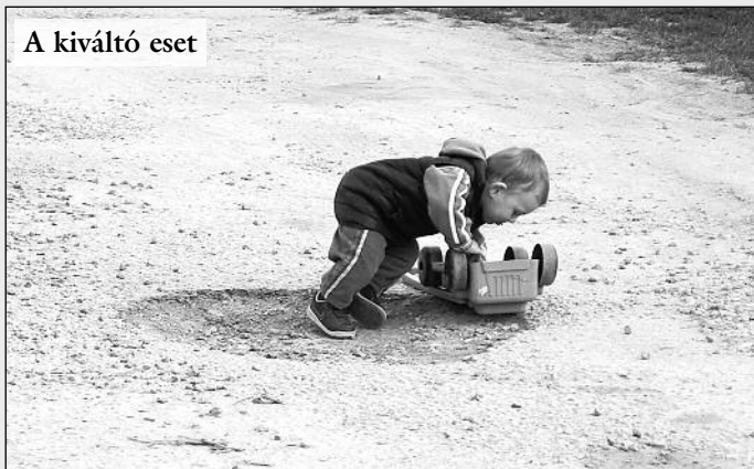
A kiváló eset

Nem sokkal ezt követően került sor az első lakógyűlésre, amit még több másik is követett, mire kiforrt a magát a koncepció. Közös gondolkodás, közös tervezés, és a kivitelezők közös keresése, azaz önkormányzati és lakóközösségi együttmozdulás hozta meg azt az eredményt, ami egy hosszú távú terv alapja lett. Az akkor még lakóközösségi hozzájárulással történő megvalósítás izgalma mára már rutin.