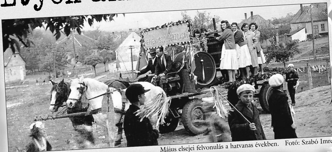
Május elsejei felvonulás a hatvanas években.