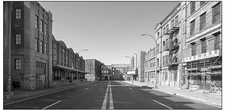
New York utca a Hellboy 2 című filmből

Sokak által várt hír, hogy ez év júniusában kerül átadásra a Korda Filmpark - Látogatóközpont, amelybe évente 50 ezer