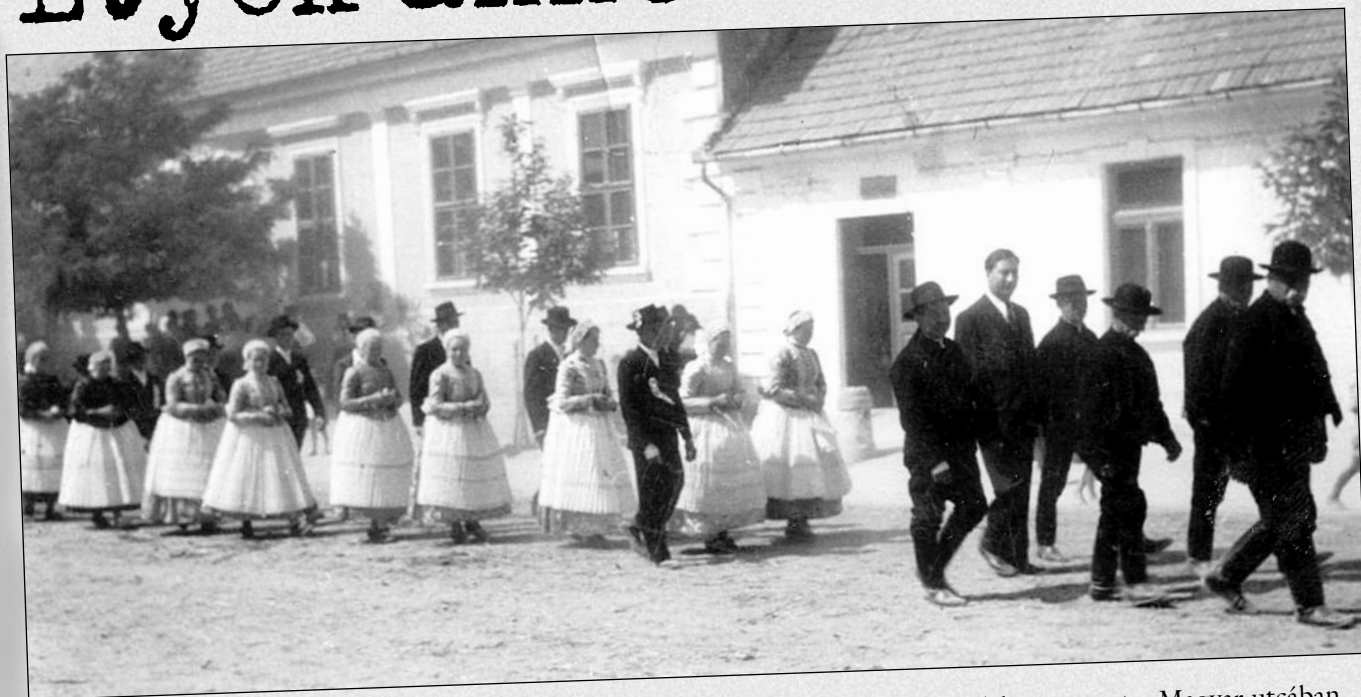
Lakodalmás menet a Magyar utcában