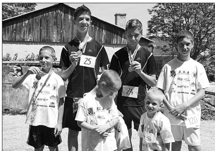
A hat Miksa gyerek közül hárman is dobogóra állhattak

Rengeteg támogató állt a 3. Etyeki Vesszőfutás zászlaja alá – úgy, hogy sokuk személyesen keresett meg Bennünket, hogy ebben az évben is kisebb-nagyobb összeggel szeretné támogatni ezt az etyeki tömegrendezvényt. A legnagyobb támogatást az Önkormányzattól és a Sportegyesülettől kaptuk. Ki kell emelnem az Etyeki Sportért Alapítványt, amely nagy szeretettel állt mellénk és szinte valamennyi rendezvényünk mellé. Köszönjük az alapítvány kuratóriumának a támogatást.