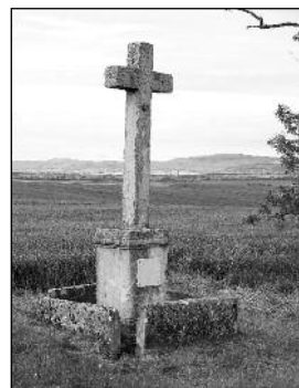
Most így néz ki a kereszt