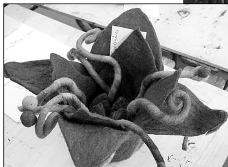
Nemezvírág (Balogh Réka)