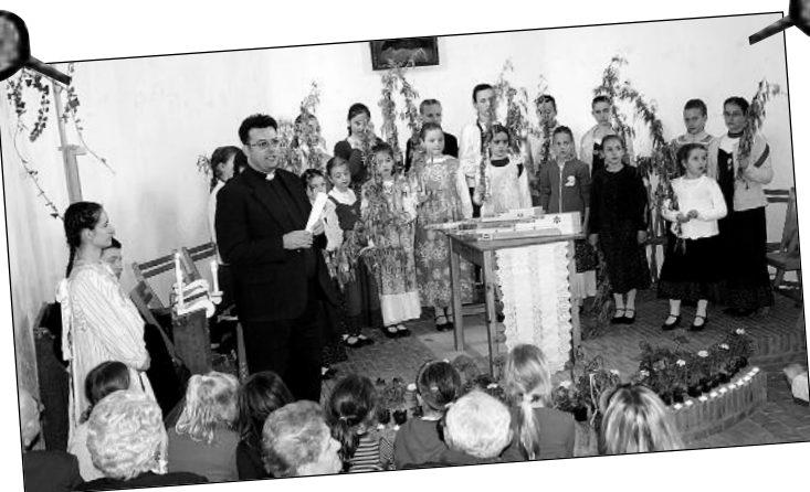
„...zur heiligen Kapelle – kő kápolnicskát láték...”