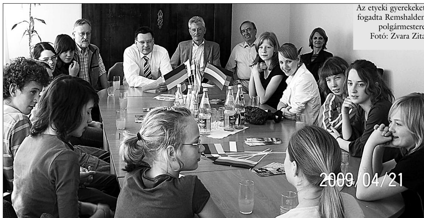
Az etyeki gyerekeket fogadta Remshalden polgármestere