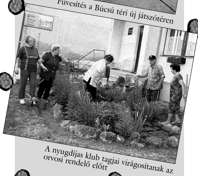
A nyugdíjas klub tagjai virágosítanak az orvosi rendelő előtt