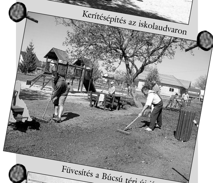
Füvesítés a Búcsú téri új játszótéren