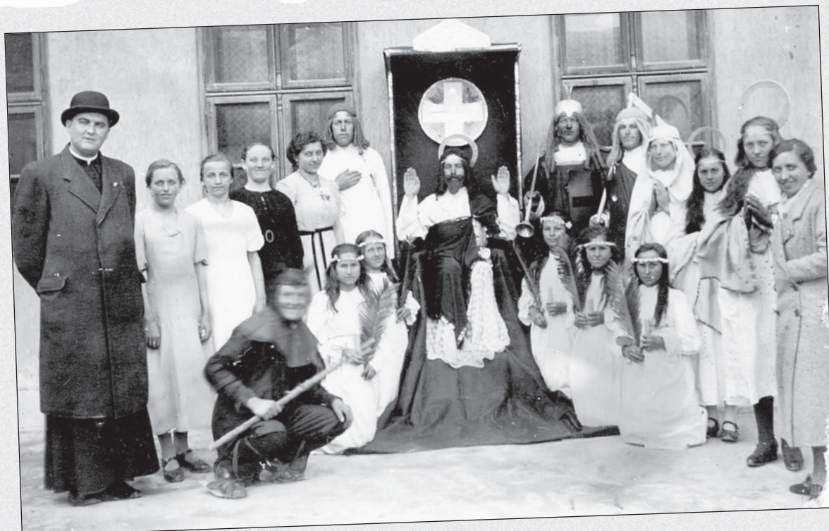
Karácsonyi színdarab résztvevői 1938-ban