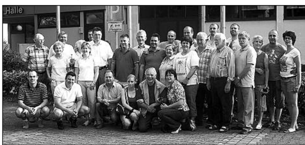
Az Alte Edecker Musikanten tagjai búcsúznak német vendéglátóiktól

autózva természetesen szó volt a két önkormányzat tevékenységéről, terveiről, gondjairól is. A mintegy másfél óras út során kölcsönös szimpátián alapuló, baráti hangulatú beszélgetés alakult ki a két polgármester között. Egyeztették az Etyeki Búcsúra érkező remshaldeni delegáció, ill. a Búcsú programját.