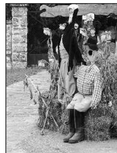
Sarlós Boldogasszony búcsúja a templomkertben