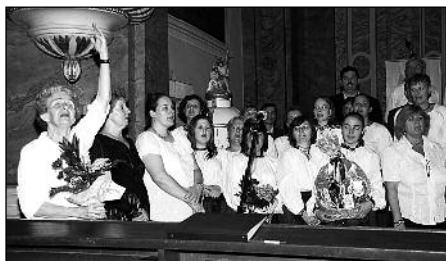
A Signum Kórusok és a tatabányai Bárdos Lajos Vegyeskar koncertje