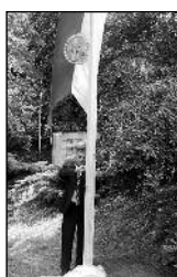
Fejér megye zászlójának ünnepélyes avatása a Hősök terén